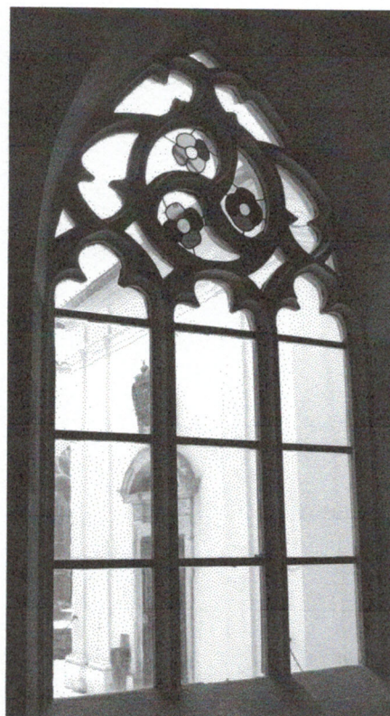
Pohled z ambitu 110127 hl 24ý