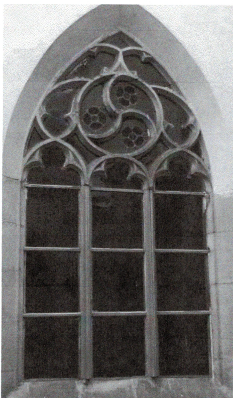
Pohled z rajského dvora 110310 hl 034

Poškozené, nevhodná náhrada kamenných prutů dřevěnými, poškozené zasklení.